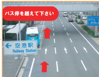
② バス停を越え前進して下さい