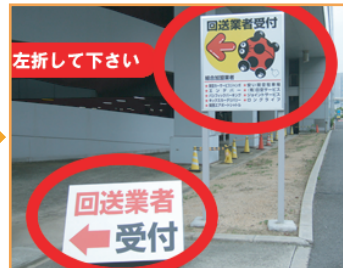
③ 回送業者受付カンバンを左折