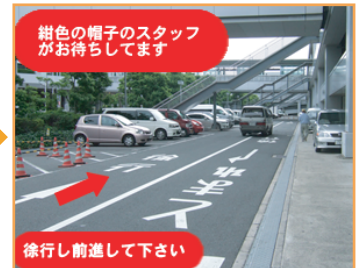
★ 紺色の帽子をかぶったスタッフがお待ちしております!