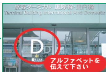
② 自動扉のアルファベット文字をお電話にてご連絡ください