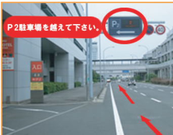
① P2駐車場を越えて前進して下さい