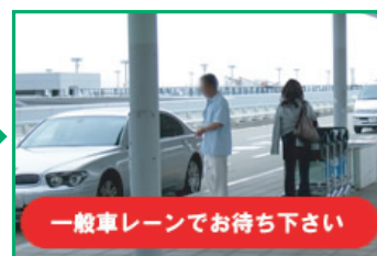
★ 一般車レーンでお待ちください お客様のお車をお持ちいたします